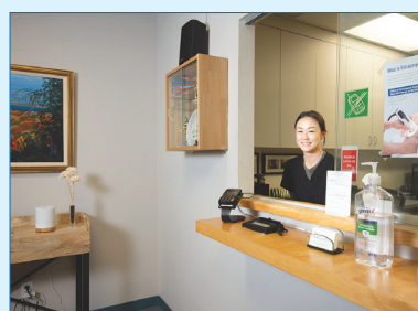
快適で落ち着いた待合室と受付セクション。クリニックは便利なカーニメサにある