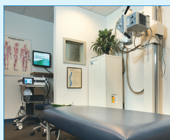
レントゲンやESWTなど、さまざまな器械が置かれている検査・治療室