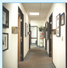
クリニックの通路には、通院したプロアスリートの写真が展示されている