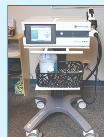
慢性痛の新たな治療法として注目されているESWT