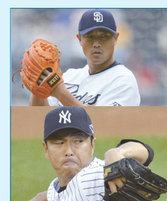
元パドレスの大塚晶文投手をはじめ、多くプロアスリートが通院